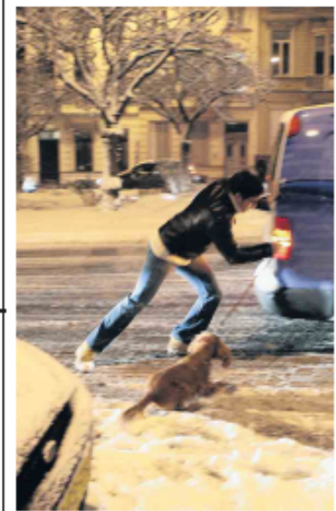
SNEEUW BRENGT OPNIEUW ELLENDE > 6